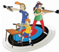
Carabine et Pistolet Ecole de Tir